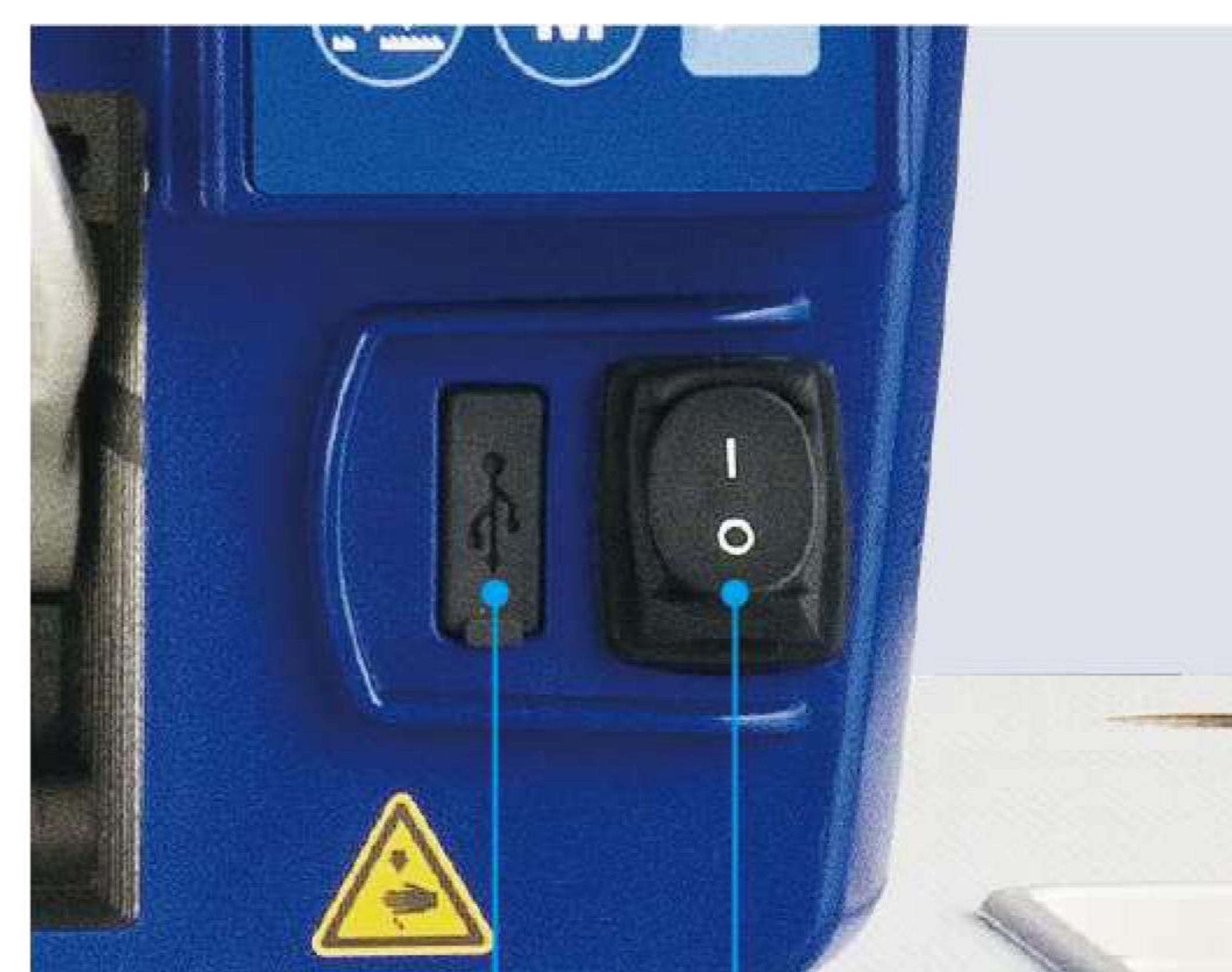
USB接口 — 电源开关

电源开关是内置在控制箱内的，从而使机器在安装时更为简便。与外部输出端子的连接也极为简单。